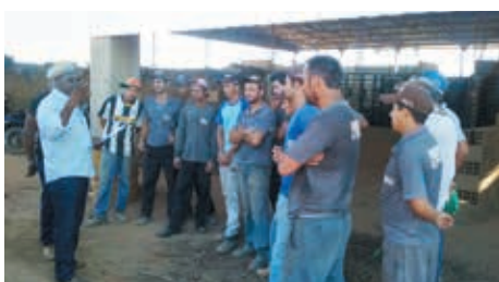
Cerâmica Santa Cruz, município de Cordeiro