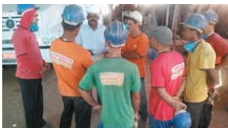
Visita às cerâmicas Dois Irmãos e Santo Expedito, no município de Presidente Jânio Quadros

Diferenças retroativas: referentes ao piso salarial, reajuste geral e anuênio podem ser pagas de forma parcelada (a critério da empresa), junto com os salários de abril e maio, respectivamente nos meses de maio e junho.