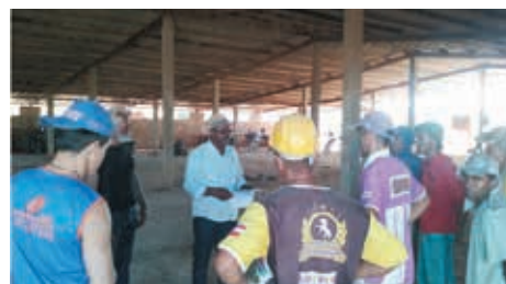
Cerâmica KL, em Maetinga