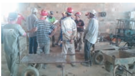
Nas cerâmicas Alto Cruzeiro e Quincas, no município de Maracás