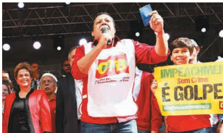
Presidente da CTB, Adilson Araújo, e a presidenta Dilma

Companheiros (as): o emprego na construção e os direitos dos trabalhadores (as) estão ameaçados. O SINTRACOM-BA, a FETRACOM-BASE e a