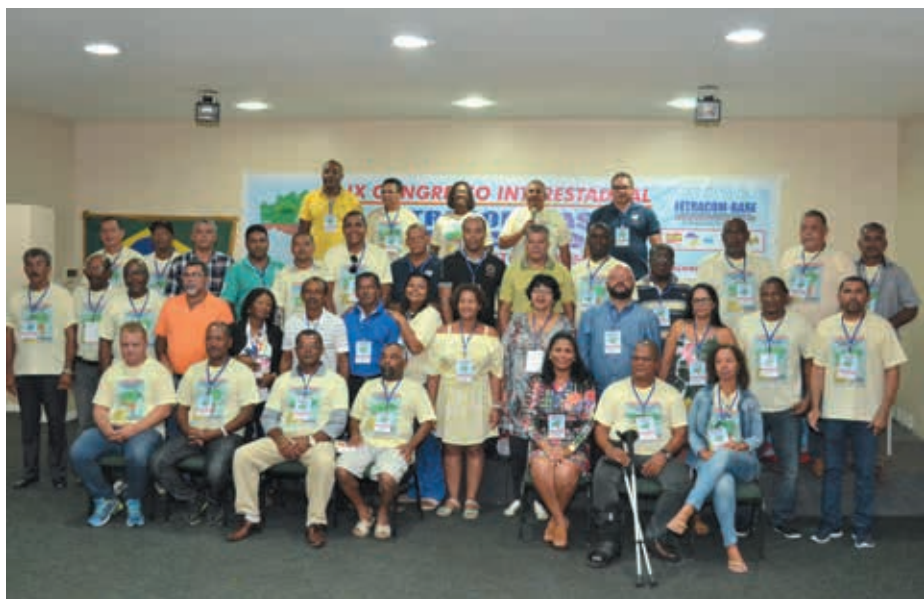
Diretoria da FETRACOM-BASE, gestão 2016/2020

O evento reuniu 110 delegados (as) da Bahia e Sergipe, além de representantes de Federações dos estados de Mi-