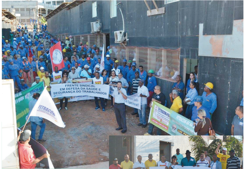
SINTRACOM-BA na luta pelo fim dos acidentes do trabalho