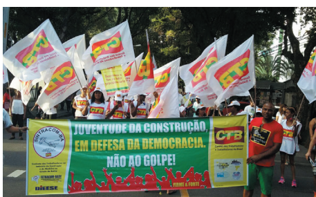
Caminhada do Campo Grande à Barra, em 31/07