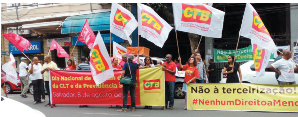
Manifestação em 08/08, na SRTE (antiga DRT), em Salvador

Tem mais prejuízos: Fim das férias e do 13º salário, congelamento dos salários por 20 anos, aumento da jornada de trabalho para 80 horas semanais, aumento