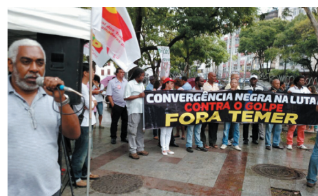
Ato contra o golpe, em 04/08, na Praça da Piedade

da idade de aposentadoria para 70 anos, fim do auxílio-doença e da aposentadoria por invalidez, fim do SUS e da universidade gratuita, corte das bolsas de estudos, terceirização da atividade-fim, entrega do pré-sal, fim da CLT, redução de 70% dos recursos da Justiça do Trabalho para acabar com ações trabalhistas e prevalência do negociado sobre o legislado (que autoriza a negociação com os patrões ter mais validade sobre qualquer vantagem mínima determinada por lei).