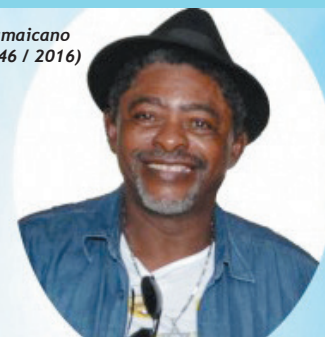
Jamaicano (1946 / 2016)

O SINTRACOM-BA perde um grande aliado. Agradecemos por tudo que fizestes por este Sindicato. Siga em paz, companheiro!