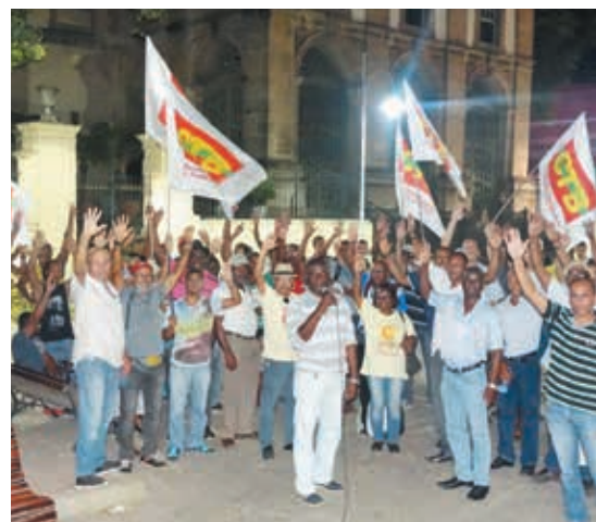
Trabalhadores (as) de diversos canteiros participaram da assembleia

BA e a FETRACOM-BASE na luta para garantir os direitos já conquistados e avançar com novas conquistas e melhorias para a categoria.