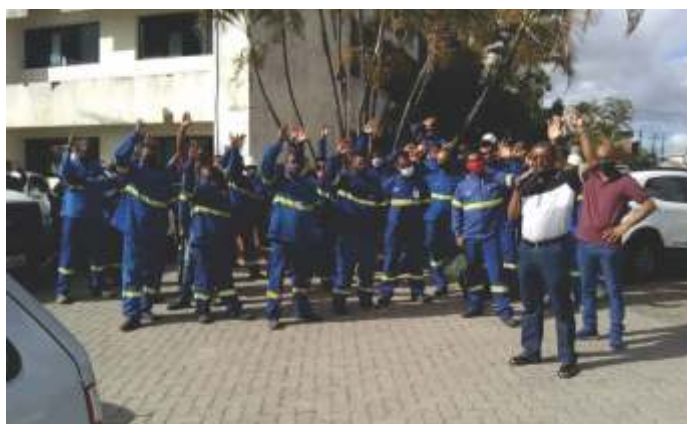
Assembleia na Dinamo