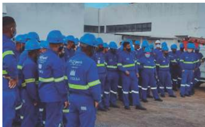
Assembleia na Floripark

O SINTRACOM-BA realizou assembleias nas portas das empresas, para apresentar a proposta da entidade patronal (Sinduscon). A FETRACOM-BASE também fez assembleias com os demais Sindicatos filiados. E os trabalhadores (as) aprovaram o reajuste de 2,95% (INPC), que será pago dividido em duas parcelas, 50% em janeiro/2021 e 50% em abril.