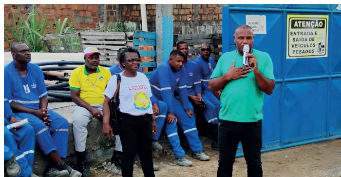
A mobilização dos trabalhadores (as) da Tubonews das Granjas Rurais e Pirajá

Os trabalhadores (as) da Tubonews, prestadora de serviços de água e saneamento básico à Embasa, retornaram às atividades nos canteiros das Granjas Rurais e Pirajá, após aprovarem em assembleia, dia 11/02, a proposta da empresa apresentada em reunião com o SINTRACOM-BA, atendendo parte das reivindicações.