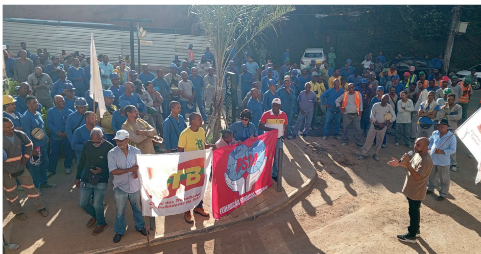
Manifestação do SINTRACOM-BA com os trabalhadores (as) no Horto Florestal

Diretores e diretoras do SINTRACOM-BA estiveram presentes e saudaram o novo secretário estadual do