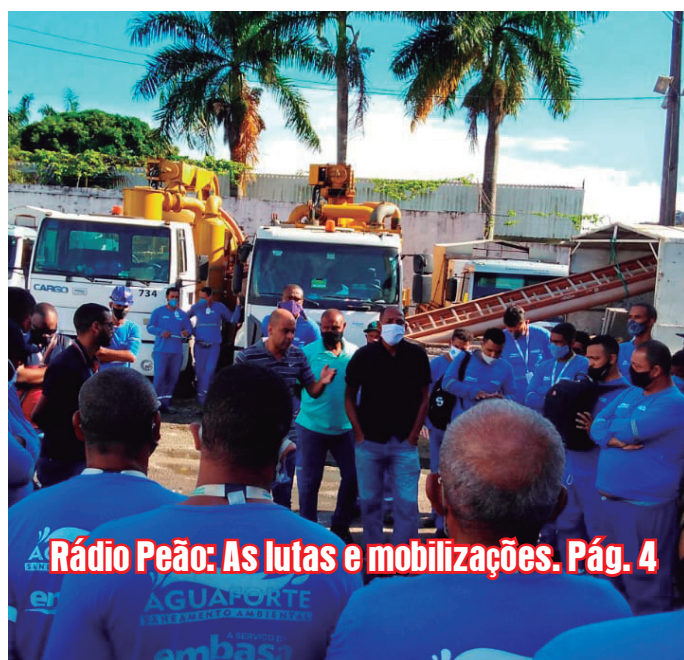
Rádio Peão: As lutas e mobilizações. Pág. 4