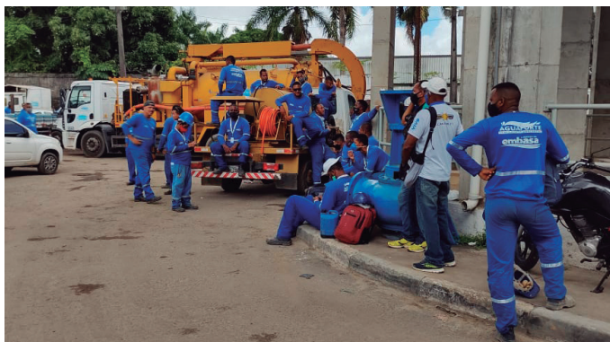
Paralisação na Água Forte, unidade do Lobato