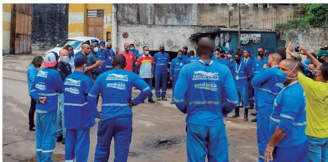
Os trabalhadores (as) da Água Forte paralisaram também na unidade de Santa Monica, dia 08/12, por atraso no pagamento dos salários. Foi regularizado no mesmo dia.

Revoltados com os constantes atrasos de salários e benefícios determinados pela Convenção Coletiva de Trabalho, trabalhadores (as) da empresa Água Forte Saneamento Ambiental (Lobato), prestadora de serviços à concessionária de água e saneamento Embasa paralisaram as atividades no dia 1º/12. O SINTRACOM-BA foi pra cima e cobrou da empresa o cumprimento da CCT e pagamento dos direitos.