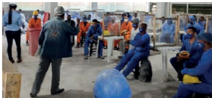
Nos canteiros: DDS na JVF Empreendimentos Imobiliários, 21/07

Quando o Brasil registra mais de 560 mil mortes na pandemia e a CPI da Covid investiga a negociação de vacina superfaturada, o desemprego atinge quase 15 milhões de trabalhadores (as), a miséria aumenta e cerca de 115 milhões de pessoas sofre com insegurança alimentar. Cresce a rejeição ao governo e Bolsonaro tenta desviar o foco para a polêmica do antigo voto impresso. Ameaça golpe na democracia, acusa fraude na urna eletrônica, em eleição que venceu. O TSE diz que é fakenews e entrou com ação no STF. O presidente não tem provas.