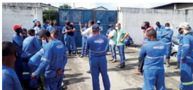
Rádio Peão: Paralisação na FPX Lander e mais lutas na pág. 2

Foi nas lutas do movimento sindical que conquistamos 13º salário, férias e adicional de um terço 1/3 do salário, jornada de