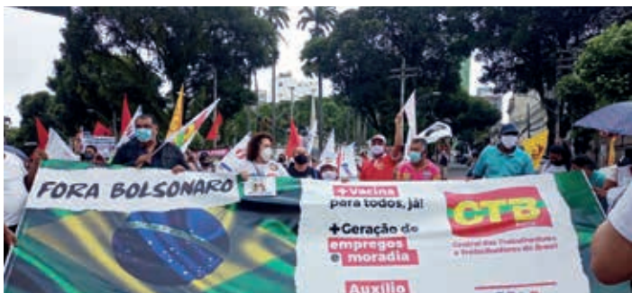
A luta nas ruas: CTB na manifestação "Fora Bolsonaro", em 24/07