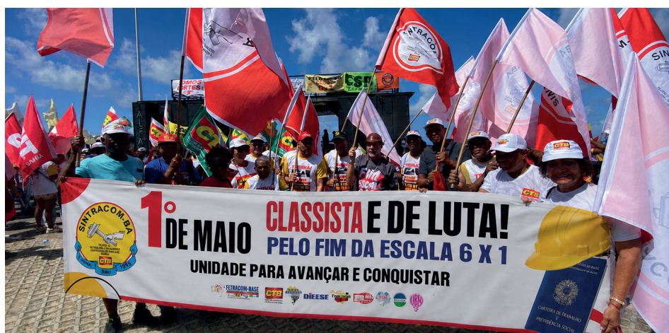
Diretores do SINTRACOM-BA presentes no ato do 1º de Maio, no Jardim de Alah, Salvador, na luta pelo fim da escala 6x1 e a defesa dos direitos da classe trabalhadora.

tura, gerar empregos e reduzir as desigualdades sociais, investimentos em obras em saúde, educação, saneamento, mobilidade, habitação e transição energética, o retorno do programa Minha Casa, Minha Vida, para construção de moradias e facilitar a compra da casa própria, para famílias de baixa e média renda, com juros reduzidos e subsídios, e medidas que beneficiam diretamente os trabalhadores (as).