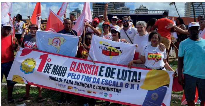
SINTRACOM-BA, FETRACOM-BASE, FLEMACON e CTB Bahia no 1º de Maio. Leia esta e outras notícias da luta, na Pág. 2.

O SINTRACOM-BA vai disponibilizar transporte, a partir das 17h, na porta do Shopping Paralela, para conduzir o público até o local do Forró. Vem com a gente!